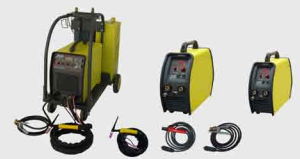
TIG AC/DC (Inverter)